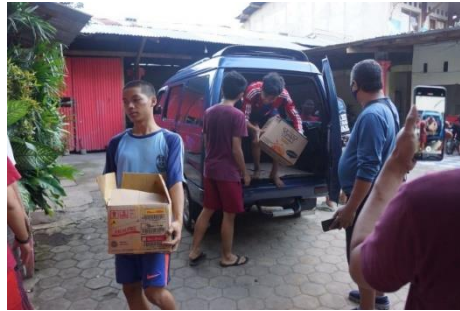
Agung Marthen Ngguso Duwi mas Duwi: Levering van rijst bami olie e.d.